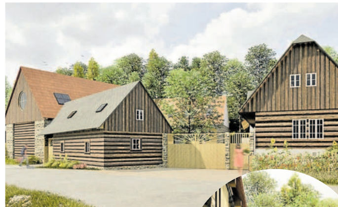
VIZUALIZACE. Takto by měla usedlost vypadat po rekonstrukci.

vodním vzhledu. Nově přistaví pouze relaxační a wellness zónu se saunou a bazénem.