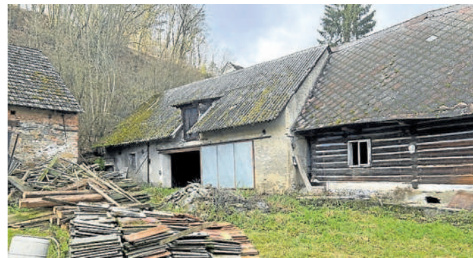
DNEŠNÍ STAV. Z této ruiny venkovské usedlosti bude penzion, který nabídne například odpočívání na peci.

Venkovskou usedlost s historickou roubenou sýpkou a kamennou stodolou koupila soukromá firma Jour Blanc, která se zabývá výstavbou bytových domů ve Středočeském kraji, a ráda by ji proměnila k unikátnímu krátkodobému nebo dlouhodobému ubytování. Celou ji opraví, aby zůstala v pů-